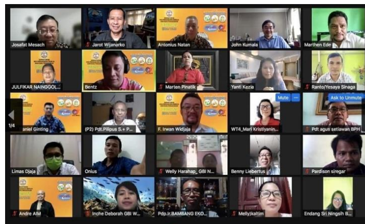
Gambar 2: Peserta Melalui Zoom Meeting

Breakroom 2: Kuliner Instan Berdaging Ayam (KIBA). Praktisi KIBA yang telah 20 tahun melakukannya berusaha mengajarkan kebutuhan terkait tentang gizi, protein, murah, terjangkau, dan mudah ditemukan. Di mulai dari frozen food dengan bahan dasar daging mentah (ayam, ikan, seafood) apa saja yang kita makan tiap hari. Diberi bumbu, masukkan ke dalam plastik, dibekukan -20°C jadi tahan sampai 2-3 bulan. Ini adalah alternatif ibu-ibu dapat membantu suami mendapatkan income tambahan dari rumah dengan menjual protein, ayam, ikan beku sehat, dan murah.