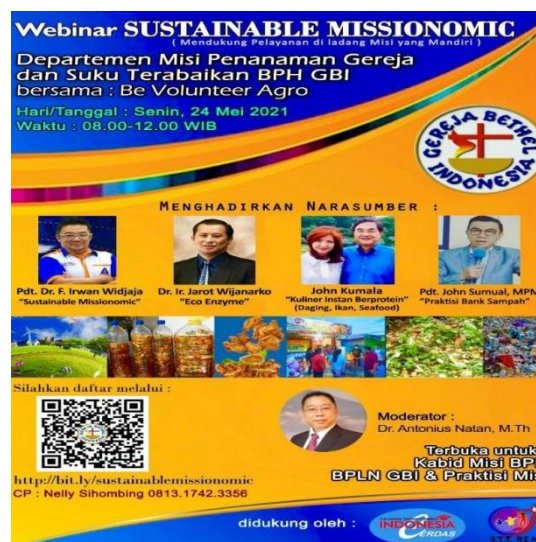
Gambar 1: Brosur Acara dan Panitia

Breakroom 1: Eco Enzyme (Ezy) , dibawakan oleh praktisi Eco Enzym Nasional yang menjelaskan Ezy merupakan larutan zat organik kompleks yang diproduksi dari proses fermentasi sisa organik, gula merah, dan air. Diproduksi dari sampah, kulit buah, sayur-sayur sisa. Eco enzyme bermanfaat untuk kehidupan sehari-hari, untuk kesehatan, air, udara, laut, dan juga pertanian. Dengan menggunakan eco enzyme dapat membantu menghilangkan pengaruh pestisida pada tanaman. Penggunaan eco enzyme untuk sejuta manfaat sesuai dosis yang ditentukan, menjadi berkah, murah, berguna untuk banyak hal.