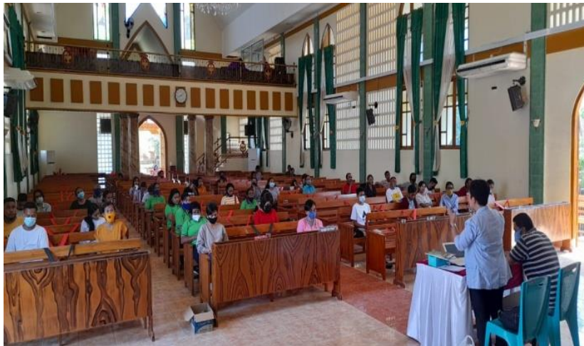
Gambar 3: Foto tim PkM sedang menyampaikan materi

Tahap Pelatihan. Tahap pelatihan ini dilakukan setelah tahap perencanaan dan tahap sosialisasi dilakukan. Tahapan pelatihan ini dilakukan untuk meningkatkan, memberi serta mengembangkan potensi dalam diri peserta kegiatan sehingga dapat benar-benar memahami dan mengetahui penggunaan panggung boneka serta dapat mengetahui cara pemasangan sampai pada penggunaan yang telah disesuaikan dengan hasil diskusi, yakni: pelatihan mengenai penggunaan panggung boneka sebagai media pengajaran dan media lainnya yang dapat dibuat dari barang daur ulang, seperti gambar, dll. Tahapan ini sangat penting karena mengingat bahwa ketika peserta mengalami secara langsung apa yang dipelajarinya, maka akan memiliki pengalaman yang lebih bertahan lama dalam diri peserta. Sesuai dengan pengalaman belajar yang disampaikan oleh seorang ahli yaitu Edgar Dale. Teori Edgar Dale yakni tentang bagaimana cara seseorang memperoleh pengertian dari jenis pengalaman yang lain, penggunaan media pembelajaran dalam proses pembelajaran kerap dapat menggunakan prinsip kerucut yakni memerlukan media sesuai kebutuhan yang dirancang oleh guru (Sari: 2019).