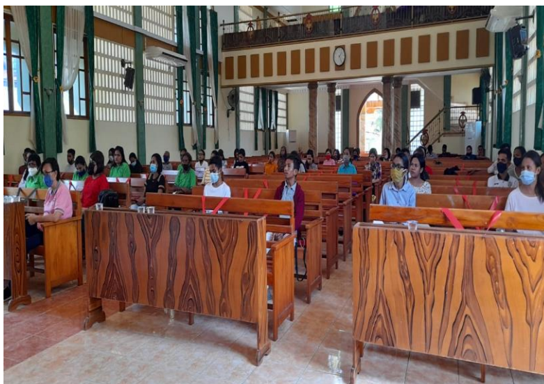
Gambar 2: Foto peserta kegiatan yang terdiri dari guru-guru sekolah minggu.

yang dilakukan, sebab sesuai dengan apa yang selama ini menjadi kebutuhan di Jemaat khususnya dalam pelayanan kategorial yaitu pelayanan anak dan remaja. Dengan demikian dapat dikatakan bahwa, pelaksanaan kegiatan PkM yang dilakukan benar-benar menjadi kebutuhan serta mencapai sasaran yang ditetapkan. Kegiatan PkM ini benar-benar menunjukkan bahwa pemanfaatan media pembelajaran seharusnya tidak saja menjadi kebutuhan dari pengajar yang berada pada jalur pendidikan formal, akan tetapi menjadi kebutuhan dari setiap pengajar.