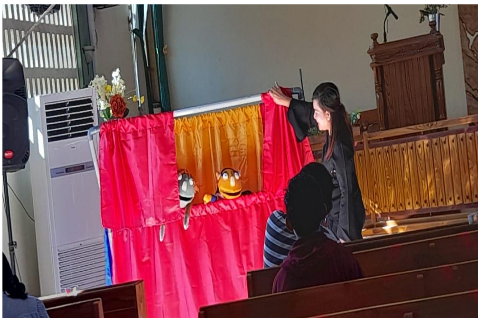
Gambar 5: Foto praktik penggunaan panggung boneka