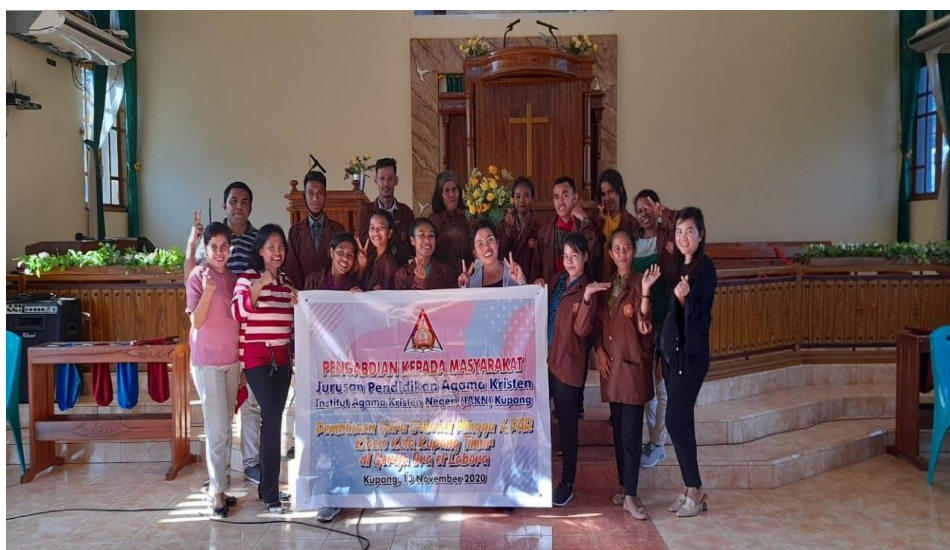
Gambar 1. Foto tahap persiapan kegiatan

Adapun pelaksanaan kegiatan dilakukan dalam beberapa tahap, yaitu: Pertama , tahap persiapan. Pada tahap persiapan terdiri dari dua tahap yaitu observasi awal dan perencanaan. Observasi awal dilakukan untuk mengetahui apa yang menjadi kebutuhan atau persoalan dari guru PAR/pengajar sekolah minggu yang berada dalam wilayah pelayanan Klasis Kota Kupang Tengah. Kedua , tahap sosialisasi. Tahapan sosialisasi merupakan tahapan kegiatan yang mana di dalamnya memuat kegiatan berupa: pemaparan/penjelasan tentang media pembelajaran dan pemanfaatan panggung boneka sebagai salah satu media yang dapat digunakan dalam kegiatan pembelajaran di sekolah minggu. Ketiga , tahap pelatihan. Tahap pelatihan adalah tahapan yang dilakukan setelah kegiatan observasi dan kegiatan sosialisasi tentang media pembelajaran. Jadi, guru sekolah minggu dilatih cara pemasangan panggung boneka, sampai pemanfaatan/penggunaan panggung boneka yang baik dan menarik sesuai dengan kebutuhan atau materi sekolah minggu yang akan diajarkan. Keempat , tahap refleksi. Di tahap ini dilakukan sebagai feed back dari kegiatan sosialisasi dan pelatihan yang dilakukan, yaitu membuka sesi diskusi untuk berbagai pertanyaan yang hendak disampaikan, serta memberikan kesempatan kepada guru sekolah minggu untuk mempraktekkan atau mengalami secara langsung penggunaan/peragaan panggung boneka.