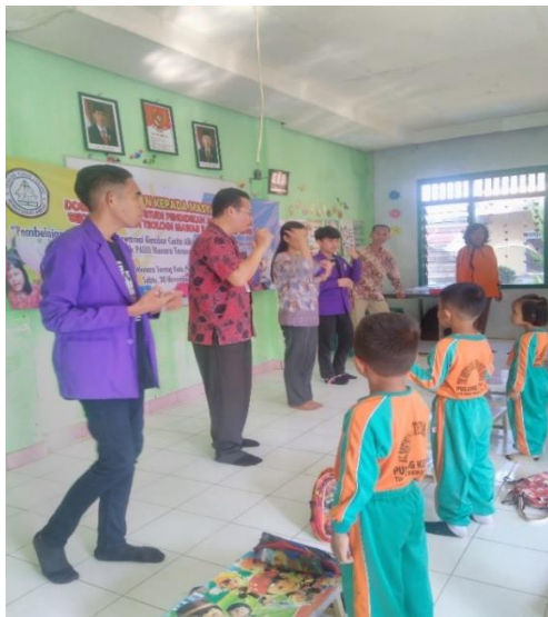
Gambar 1: Bernyanyi dengan Gerakan

didik, 9 membuat mereka lebih memahami pujian yang mereka nyanyikan dan meningkatkan daya ingat mereka akan lagu yang mereka nyanyikan. Bernyanyi dengan diiringi musik dapat meningkatkan daya ingat anak. 10 Pada saat bernyanyi, para peserta didik sangat senang dan bahagia. Peserta didik bersemangat dalam bernyanyi dan mengikuti gerakan lagu sesuai yang dicontohkan tim PkM di depan mereka. Dalam kesempatan bernyanyi ini, tim PkM juga mengajari peserta didik lagu baru dan peserta didik terlihat antusias. Lagu-lagu dipilih yang sesuai dengan usia anak PAUD. Pemilihan lagu, bernyanyi dengan gerakan dilakukan sebagai bentuk penguatan iman mereka, melalui lagu-lagu yang dinyanyikan peserta didik diharapkan dapat memahami Allah dan memiliki kesukaan memuji Allah, dengan demikian iman mereka dapat bertumbuh.