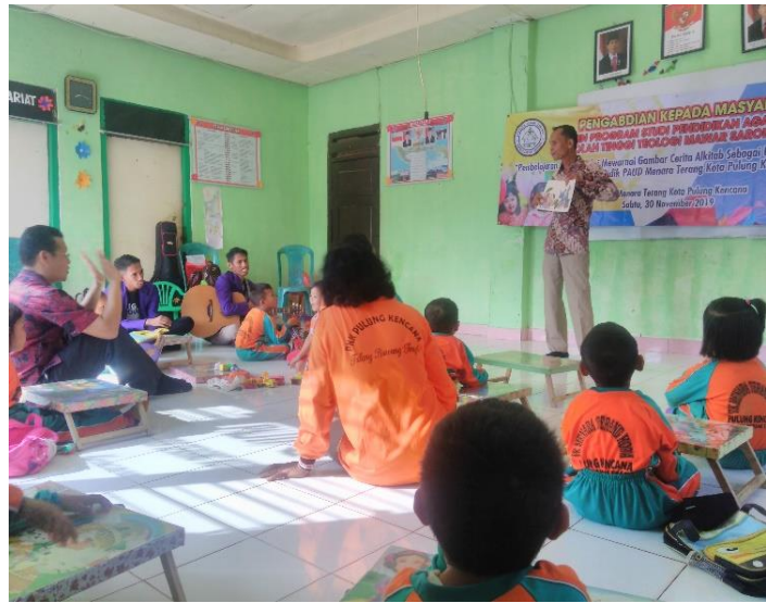
Gambar 2: Bercerita Menggunakan Gambar Cerita Alkitab

Setelah selesai sesi/tahap bernyanyi, tim PkM lanjut pada tahap bercerita yang disampaikan oleh S. Marbun. Cerita yang disampaikan adalah cerita firman Tuhan yang diambil dari Alkitab (Mat. 21:1-11). Cerita Alkitab yang diambil oleh tim PkM adalah cerita tentang Tuhan Yesus memasuki Yerusalem bersama dengan murid-murid-Nya dengan mengendarai seekor keledai. Setibanya di Yerusalem sejumlah besar orang telah menantikan