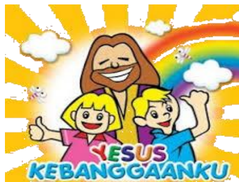
Gambar 6. Media Gambar