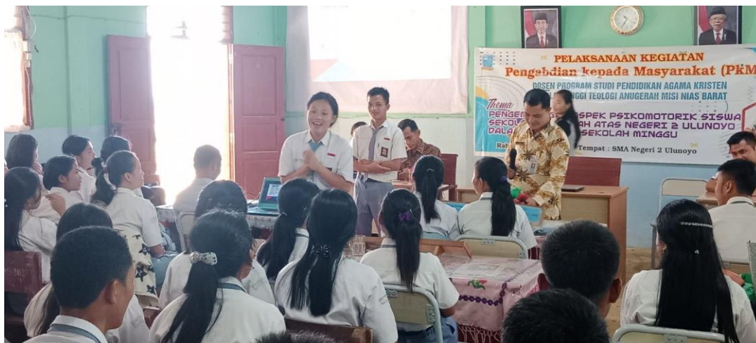
Gambar 3. Salah satu peserta mempratekkan cara bercerita Firman Tuhan yang menarik