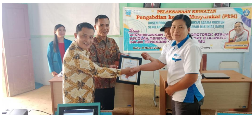
Gambar 7. Pelaksana PkM Menyerahkan Piagam Penghargaan kepada SMA Negeri 2 Ulunoyo

Pengembangan aspek psikomotorik siswa Sekolah Menengah Atas Negeri 2 Ulunoyo dalam mengajar sekolah minggu merupakan program yang sangat penting untuk melatih dan memberikan pemahaman kepada siswa bahwa menjadi guru sekolah minggu tidak hanya sekedar mengajar dan menyampaikan Firman Tuhan. Mengajar sekolah dibutuhkan kreativitas yang tinggi, imajinasi yang baik dan pelaksanaan yang kreatif, dinamis dan efektif serta menyenangkan. Siswa sangat merespon kegiatan pengabdian kepada masyarakat ini, sebab menambah pengetahuan dan pengalaman mereka tentang pelayanan sekolah minggu. Oleh karena itu, aspek psikomotorik sangat penting untuk dikembangkan melalui pelatihan, persiapan, belajar dan keterampilan lainnya. Diakhir kegiatan PkM ini, disampaikan pesan penting kepada peserta bahwa jadilah guru sekolah minggu di gereja masing-masing dengan penuh tanggungjawab, jangan pernah berhenti belajar dan melatih diri anda bagaimana cara, strategi dan pengetahuan tentang pelayanan sekolah minggu. Pada akhir kegiatan ini, ditutup dengan penyerahan piagam penghargaan kepada SMA Negeri 2 Ulunoyo.