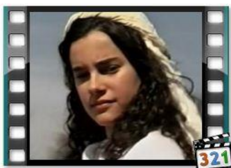
LAZARUS DAN ORANG KAYA Gambar 5. Media Film

Beberapa contoh media yang dapat digunakan untuk mengajar sekolah minggu, agar kegiatan dan pelayanan sekolah minggu yang dilaksanakan kreatif.