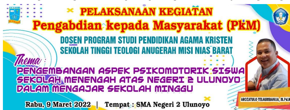
Gambar 1. Spanduk Kegiatan Pengabdian kepada Masyarakat (PkM)

Metode yang digunakan dalam kegiatan pengabdian kepada masyarakat ini adalah metode kombinasi, yaitu dengan menggabungkan metode ceramah, tanya jawab, dan bermain peran ( role playing ) dalam satu kegiatan. Metode ceramah merupakan metode menyampaikan materi yang bersifat satu arah. Metode tanya jawab merupakan dialog yang terjadi dua arah. Metode bermain peran merupakan metode keterlibatan peserta atau siswa SMA Negeri 2 Ulunoyo untuk mempraktekkan bagaimana cara mengajar sekolah minggu yang kreatif dan efektif. Kegiatan pengabdian kepada masyarakat (PkM) ini dilaksanakan pada hari Rabu, 9 Maret 2022 bertempat di Sekolah Menengah Atas Negeri 2 Ulunoyo. Jumlah peserta pada kegiatan PkM ini adalah 81 orang siswa yang terdiri atas siswa kelas XII dan Bapak/Ibu Guru SMA Negeri 2 Ulunoyo. Selain itu, adapun media yang digunakan dalam kegiatan PkM tersebut adalah spanduk, spidol, kertas, gunting, komputer, LCD Projector, powerpoint.