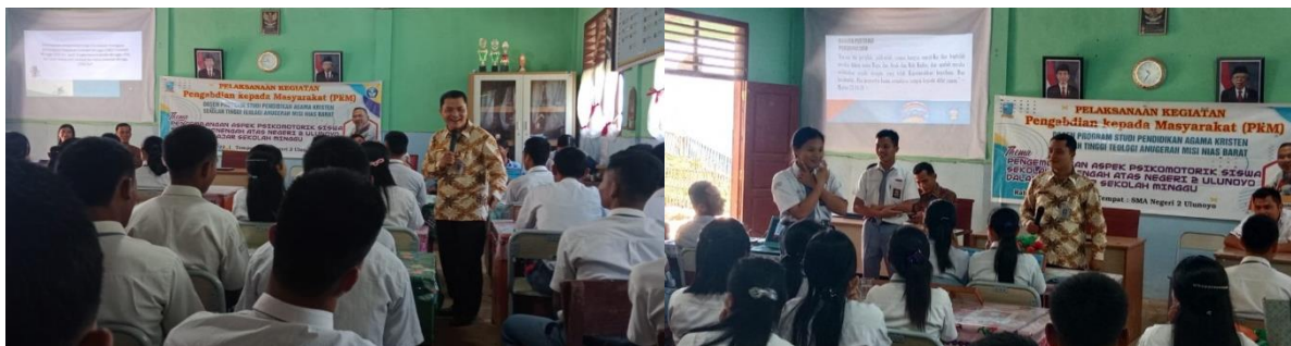
Gambar 2. Kegiatan PkM Menerapkan Metode Ceramah dan Bermain Peran