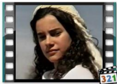
LAZARUS DAN ORANG KAYA

Beberapa contoh media yang dapat digunakan untuk mengajar sekolah minggu, agar kegiatan dan pelayanan sekolah minggu yang dilaksanakan kreatif.