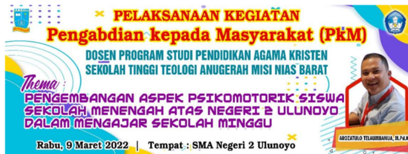
Gambar 1. Spanduk Kegiatan Pengabdian kepada Masyarakat (PkM)

Metode yang digunakan dalam kegiatan pengabdian kepada masyarakat ini adalah metode kombinasi, yaitu dengan menggabungkan metode ceramah, tanya jawab, dan bermain peran ( role playing ) dalam satu kegiatan. Metode ceramah merupakan metode menyampaikan materi yang bersifat satu arah. Metode tanya jawab merupakan dialog yang terjadi dua arah. Metode bermain peran merupakan metode keterlibatan peserta atau siswa SMA Negeri 2 Ulunoyo untuk mempraktekkan bagaimana cara mengajar sekolah minggu yang kreatif dan efektif. Kegiatan pengabdian kepada masyarakat (PkM) ini dilaksanakan pada hari Rabu, 9 Maret 2022 bertempat di Sekolah Menengah Atas Negeri 2 Ulunoyo. Jumlah peserta pada kegiatan PkM ini adalah 81 orang siswa yang terdiri atas siswa kelas XII dan Bapak/Ibu Guru SMA Negeri 2 Ulunoyo. Selain itu, adapun media yang digunakan dalam kegiatan PkM tersebut adalah spanduk, spidol, kertas, gunting, komputer, LCD Projector, powerpoint.