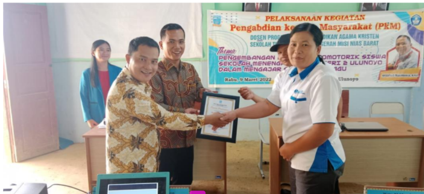
Gambar 7. Pelaksana PkM Menyerahkan Piagam Penghargaan kepada SMA Negeri 2 Ulunoyo

47 Pengembangan aspek psikomotorik siswa Sekolah Menengah Atas Negeri 2 Ulunoyo dalam mengajar sekolah minggu merupakan program yang sangat penting untuk melatih dan memberikan pemahaman kepada siswa bahwa menjadi guru sekolah minggu tidak hanya sekedar mengajar dan menyampaikan Firman Tuhan. Mengajar sekolah dibutuhkan kreativitas yang tinggi, imajinasi yang baik dan pelaksanaan yang kreatif, dinamis dan efektif serta menyenangkan. 21 Siswa sangat merespon kegiatan pengabdian kepada masyarakat ini, sebab menambah pengetahuan dan pengalaman mereka tentang pelayanan sekolah minggu. Oleh karena itu, aspek psikomotorik sangat penting untuk dikembangkan melalui pelatihan, persiapan, belajar dan keterampilan lainnya. Diakhir kegiatan PkM ini, disampaikan pesan penting kepada peserta bahwa jadilah guru sekolah minggu di gereja masing-masing dengan penuh tanggungjawab, jangan pernah berhenti belajar dan melatih diri anda bagaimana cara, strategi dan pengetahuan tentang pelayanan sekolah minggu. Pada akhir 45 kegiatan ini, ditutup dengan penyerahan piagam penghargaan kepada SMA Negeri 2 Ulunoyo.