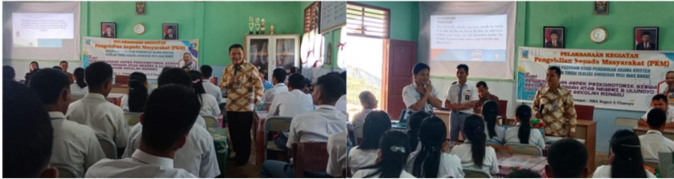
Gambar 2. Kegiatan PkM Menerapkan Metode Ceramah dan Bermain Peran