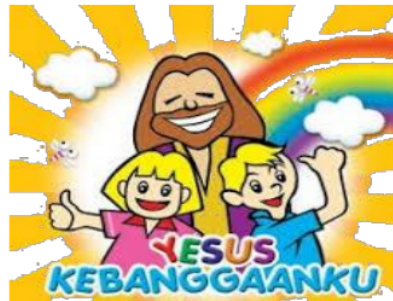
Gambar 6. Media Gambar