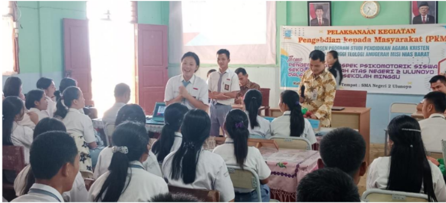
Gambar 3. Salah satu peserta mempratekkan cara bercerita Firman Tuhan yang menarik