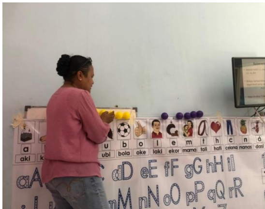
Gambar 2: Pertemuan Kedua – Praktek Gerakan Huruf Dalam Kata untuk kata “saku”

Pada pertemuan yang kedua, disampaikan materi tentang pra menulis. Banyak kegiatan dan permainan pra menulis yang dilakukan, seperti menulis di udara, menulis di punggung teman, atau menggerakkan tangan dan anggota badan. Peserta pelatihan diminta untuk memperagakan gerakan-gerakan untuk setiap huruf. Contohnya saat pemateri menyebutkan satu kata, para peserta akan berdiri atau berjongkok atau berselonjor sesuai dengan huruf dari kata tersebut. Kegiatan pembelajaran seperti ini dimaksudkan agar murid dapat memahami bentuk-bentuk huruf dengan baik dan dapat menuliskannya dengan benar.