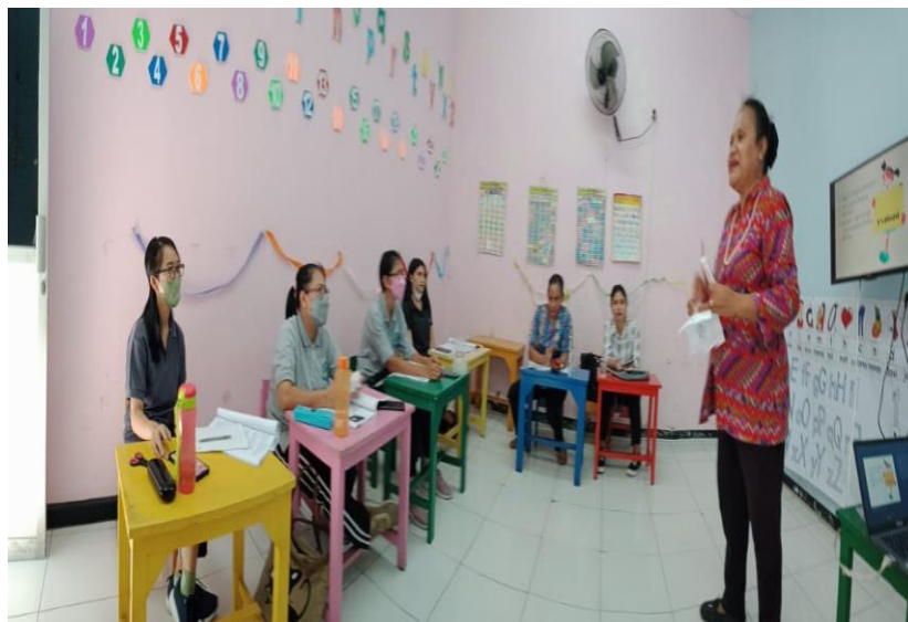
Gambar 1: Pertemuan Pertama Penyampaian Materi Proses Membaca

Konsep mengajarkan bunyi huruf masih tergolong baru untuk para guru KB-TK Bintang Nusantara. Pengajaran bunyi huruf dianjurkan agar nantinya tidak membingungkan anak ketika akan membaca. Beberapa latihan pengucapan bunyi huruf, permainan dan menyanyikan lagu dengan menggunakan bunyi huruf diajarkan dan langsung dipraktikkan oleh para peserta. Metode pembelajaran melalui permainan banyak dipraktikkan karena bagi pada dasarnya hakikat dari anak PAUD adalah bermain. 8