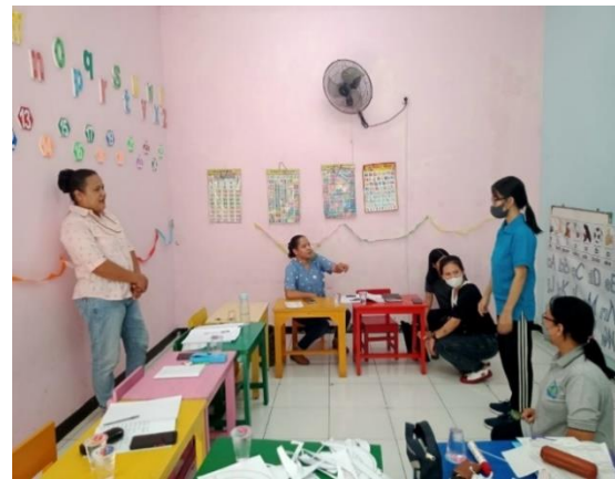
Gambar 3: Pertemuan Ketiga – Praktek Berhitung