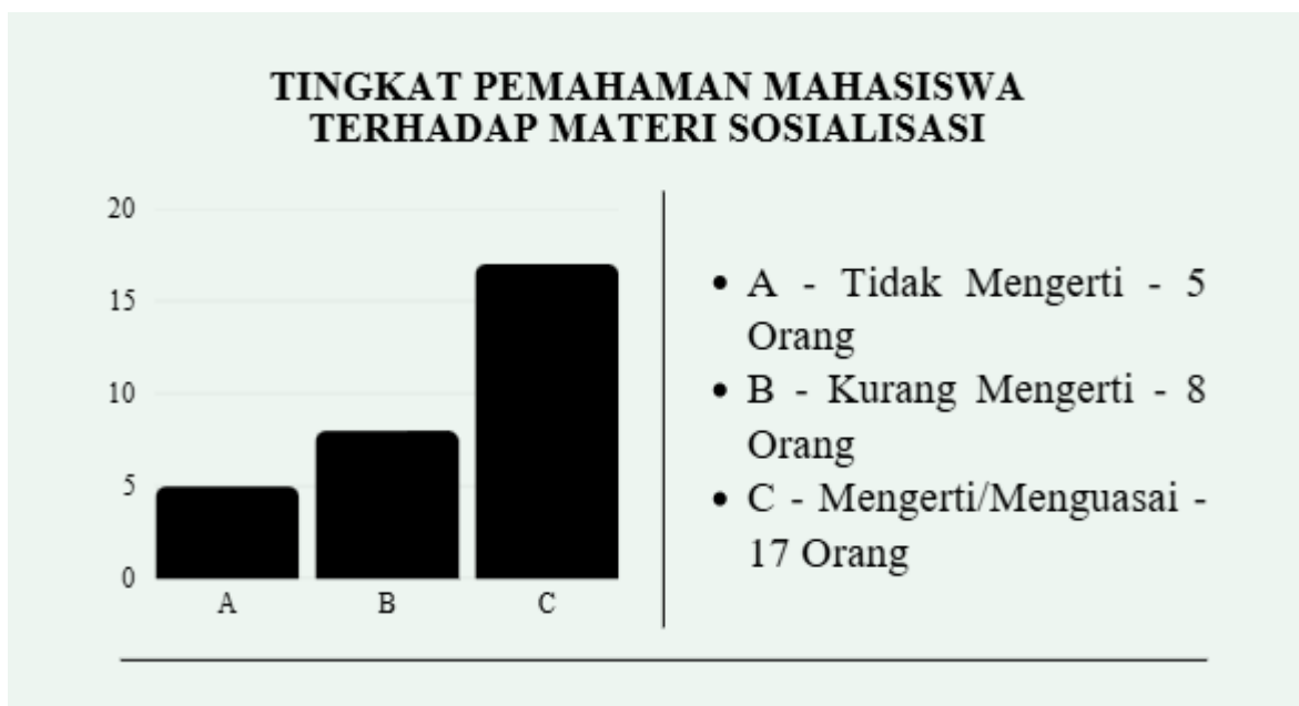
Gambar 5. Grafik Tingkat Pemahaman Mahasiswa terhadap Materi Kegiatan Pengabdian

Sebagai tindak lanjut dari hasil evaluasi, sebanyak 13 mahasiswa yang masih tergolong dalam kategori tidak mengerti (5 orang) dan kurang mengerti (8 orang) akan diberikan pendampingan tambahan melalui beberapa strategi. Pertama, dilakukan sesi pengayaan materi secara lebih sederhana dengan menggunakan contoh-contoh nyata yang dekat dengan kehidupan mahasiswa, baik dalam konteks akademik (misalnya plagiarisme, manipulasi nilai) maupun sosial (fenomena nepotisme di Papua). Kedua, diadakan diskusi kelompok kecil yang memungkinkan mahasiswa lebih leluasa mengajukan pertanyaan dan mendalami nilai-nilai kejujuran, keadilan, kesetiaan, dan kerendahan hati. Ketiga, mahasiswa diarahkan untuk menyusun refleksi pribadi tertulis mengenai relevansi pendidikan antikorupsi dalam kehidupan sehari-hari, sehingga pemahaman mereka dapat diukur kembali. Dengan langkah-langkah ini, memungkinkan seluruh peserta mampu mencapai tingkat penguasaan materi yang lebih baik.