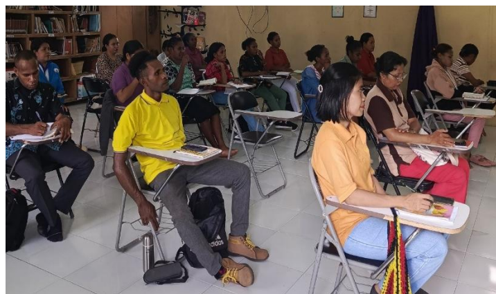
Gambar 3. Pemaparan Keadilan sebagai Refleksi dari Karakter Allah yang Adil

Sesi kedua diselenggarakan pada, Selasa, 04 Maret 2025; topik, “Keadilan sebagai Refleksi dari Karakter Allah yang Adil” yang terlihat pada (Gambar 3). Pengabdian menjelaskan keadilan dalam kekristenan tidak sekadar konsep hukum atau sosial, melainkan merupakan manifestasi dari karakter Allah sendiri yang secara konsisten menyatakan keadilan dalam seluruh karya-Nya. Dalam Mazmur 89:15, Allah digambarkan sebagai pribadi yang “ keadilan dan hukum adalah tumpuan takhta-Nya ” yang menegaskan bahwa keadilan adalah atribut ilahi yang tidak dapat dipisahkan dari keberadaan-Nya. 21 Pengabdian menekankan kepada mahasiswa bahwa sebagai pribadi-pribadi yang dipanggil untuk mencerminkan karakter Allah dalam pelayanan dan kehidupan sosial, maka nilai keadilan mesti diwujudkan secara nyata dalam perilaku, keputusan, dan relasi sosial. Dalam konteks Indonesia yang masih sarat dengan praktik ketidakadilan, seperti korupsi, nepotisme, dan penyalahgunaan kekuasaan, mahasiswa teologi dipanggil untuk menjadi saksi keadilan Allah. 22