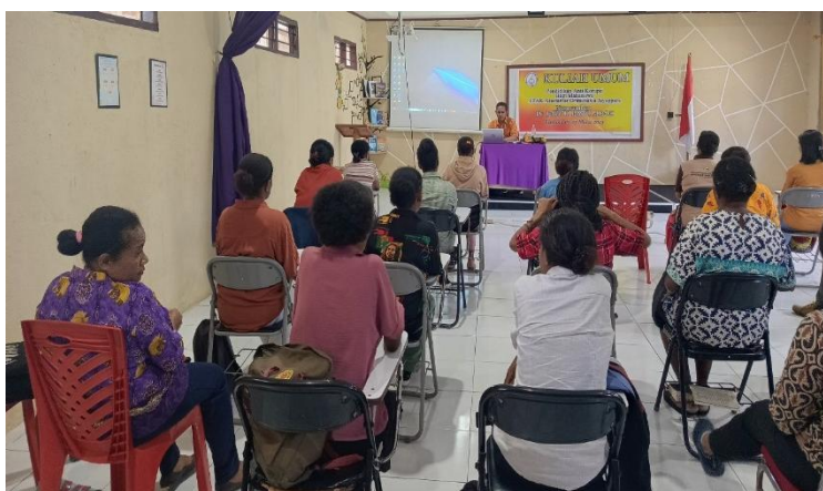
Gambar 4. Pemaparan tentang tanggung jawab, panggilan hidup, Kerendahan hati dan kerakusan

Pengabdi menguraikan nilai kerendahan hati sebagai prinsip yang melandasi sikap anti-korupsi. Kerendahan hati tidak hanya berarti sikap rendah hati secara sosial, tetapi penolakan radikal terhadap dominasi ego dan kerakusan yang merupakan akar korupsi. Dalam Lukas 22:26-27, Yesus menegaskan bahwa yang terbesar di antara para murid adalah yang melayani, bukan yang memerintah. 26 Nilai ini menjadi kritik teologis terhadap budaya kekuasaan yang disalahgunakan demi kepentingan pribadi. Mahasiswa teologi didorong untuk membangun kepemimpinan yang melayani, bukan mengeksploitasi, dan ini hanya dapat dicapai melalui kerendahan hati yang tulus. 27 Dalam praktiknya, pengabdi mengajak