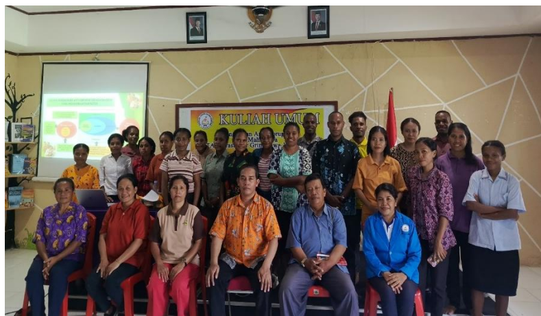
Gambar 6. Foto Bersama dengan Team PkM

Program pengabdian ini tidak berhenti pada tahap sosialisasi, melainkan dirancang untuk berlanjut dalam bentuk kegiatan lanjutan yang lebih aplikatif. Ke depan, mahasiswa akan dilibatkan dalam praktikum atau lokakarya yang memungkinkan mereka mengembangkan keterampilan nyata dalam mengintegrasikan nilai-nilai antikorupsi dalam konteks akademik maupun pelayanan. Selain itu, program ini juga akan diarahkan pada integrasi pendidikan antikorupsi berbasis iman Kristen ke dalam mata kuliah yang relevan, sehingga nilai kejujuran, tanggung jawab, kesetiaan, keadilan, dan kerendahan hati dapat terus ditanamkan secara sistematis dalam proses pembelajaran. Dengan demikian, pengabdian ini tidak hanya memberi dampak jangka pendek melalui peningkatan pemahaman mahasiswa, tetapi juga berpotensi membangun tradisi akademik yang berintegritas dan berkesinambungan di lingkungan STAK Arastamar Grimenawa Jayapura, Papua.