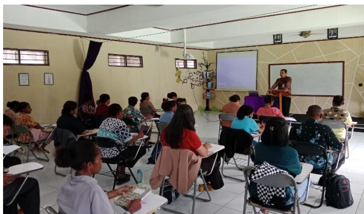
Gambar 2. Pemaparan Kejujuran sebagai Ekspresi dari hidup dalam terang Kebenaran Kristus

Guna memperdalam materi, pengabdian menghubungkan antara kejujuran dan tanggung jawab etis dalam kepemimpinan rohani. Mahasiswa didorong untuk memahami bahwa korupsi tidak selalu berwujud dalam bentuk besar seperti penyelewengan dana, tetapi bisa dalam bentuk kecil seperti manipulasi nilai, plagiarisme akademik, atau penyalahgunaan kepercayaan. Maka, pengabdian menekankan bahwa hidup jujur sejak masa studi adalah langkah preventif yang konkret dalam memutus mata rantai budaya korupsi yang sering kali dimulai dari kompromi-kompromi kecil. Sebagai bagian dari pendekatan kontekstual, pengabdian mengajak mahasiswa untuk menganalisis fenomena sosial di Papua yang berkaitan dengan lemahnya pengawasan publik, praktik nepotisme, serta ketimpangan distribusi sumber